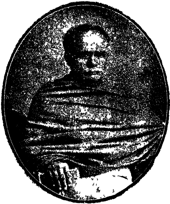
পণ্ডিত নবচন্দ্র বিদ্যাসাগর