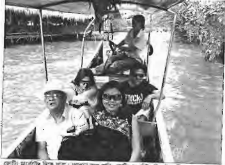
ক্রোটিং মার্কেটের দিকে যাত্রা। খেলপনে বলে বাঁধ, ক্রোটিং মার্কেটের বিঘারসা অন্ধি ফালসু।

পতিতাদের সবার সামনেই হাতা পিতা করছে। নিজ দেশে এই কাজ করলে তাকে পুলিশে ধরে নিয়ে যেত। পয়সা খরচ করে মজা পেতে তারা এই দেশে এসেছে। তাদের চোখে এটা প্রসটিটিউটদের দেশ। সব মেয়েই প্রসটিটিউট।