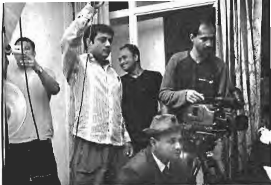
স্বাধীন বসন্ত লাইটম্যানের ছবিগার।