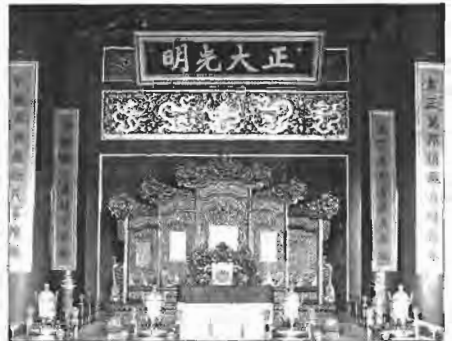
নিষিদ্ধ নগরীর দর্শীর পরিভ্রমণের প্রাসাদে রাজা সিংহাসন

প্রথমবার নিষিদ্ধ নগরীতে ঢুকে এমন মন খারাপ হয়েছিল। মনে হচ্ছিল, চীনের হতদরিদ্র মানুষদের দীর্ঘনিঃশ্বাসে বাতাস ভারী হয়ে আছে। রক্ষিতারা যেখানে থাকত সেখানে গেলাম। একসঙ্গে তিন হাজার রক্ষিতার থাকার ব্যবস্থা। প্রত্যেকের জন্যে পায়রার খুপড়ির মতো খুপড়িমর। কী বিভৎস তাদের জীবন! ইচ্ছে হলে কোনো একদিন কিছুক্ষণের জন্যে এদের একজনকে হুয়াট ডেকে নেবেন। কিংবা নেবেন না। উপহার হিসেবে পাঠাবেন ভিনদেশের রাজা-মহারাজাদের কাছে।