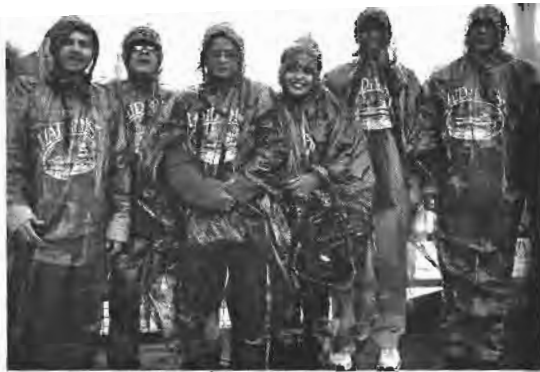
নায়েমী বঙ্গলসমূহের নিচে যাবার প্রকৃতি। সেবে মনে হচ্ছে না একদল অভিনেত্রী ?