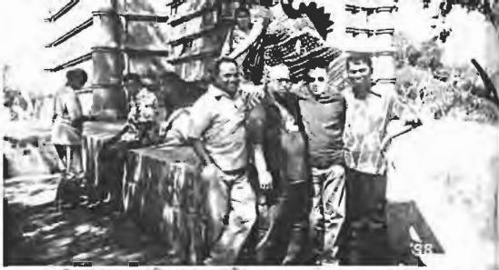
উদয়পুরের ত্রুপনেশ্বর মন্দির গ্রামে সমবেদসভা

রঙ। যেন গাছের পাতায় জোছনা নেমে এসেছে। সঙ্গে সঙ্গে সিঁদাও, যেতে হবে ত্রিপুরা। কারণ নীলমণি লতা গাছ রবীন্দ্রনাথ প্রথম দেখেন ত্রিপুরায় মালঞ্চ নামের বাড়িতে। মালঞ্চ বাড়িটি রাজপরিবার রবীন্দ্রনাথকে উপহার হিসেবে দিয়েছিলেন। বাড়ির চারদিকে নানান গাছ। একটা লতানো গাছে অদ্ভুত ফুল ফুটেছে। রবীন্দ্রনাথ গাছের নাম জানতে চান। স্থানীয় যে নাম তাঁকে বলা হয় তা তাঁর পছন্দ হয় না। তিনি গাছটার নাম দেন 'নীলমণি লতা'।