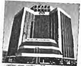
আমিমা প্রাণা সোসাইটি, বেইজিং

এই সৌভাগ্য আমার প্রায়ই হয়। অ্যাথলেটিক সিরিয়াস কিছু গুণ্ডা পাওয়া যায়। তারা যে