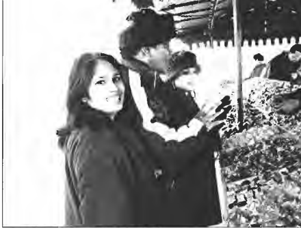
ভেষজ বিশ্ববিদ্যালয়ের সামনে তরুনো ফলের মেলা।

মহান চিকিৎসকরা আমাদের মল-মূত্র-কফ কিছুই পরীক্ষা করবেন না। নাড়ি দেখে সব বলে দেবেন।