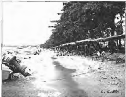
এই সেই বিখ্য শম্বর সৈকত। বেশে মনে হচ্ছে আমাদের হাট। (পাতায়া)

'সুন্দরবন'। যেন সুন্দরবন ছাড়া আমাদের আর কিছু নেই। মাহফুজ-শাওনের প্রায় ষ্পল্পপুরী শ্যামদেশের ব্যাপারে বইটি কী বলছে দেখতে গিয়ে পাতা উল্টালাম। আমি হতভম্ব। শ্যামদেশের এম্ব্লি আছে তেত্রিশটি— কেয়ং সোংফা জলপ্রপাত, ফু কয়া বক ফার্মশন, দুই ইনখন পর্বত...। এর মধ্যে একটা এম্ব্লি আমার মন হরণ করল— Naga Fireballs. এখানের ঘটনা হচ্ছে, প্রতিবছর এগারো চন্দ্রমাসের পূর্ণচন্দ্রের রাতে মেকং নদীর একশ কিলোমিটার দৈর্ঘ্য ত্রুড়ে নদীর তেতর থেকে শত শত আঙনের গোলা উঠে আসে। অগ্নিগোলক টেনিস বল আকৃতির। সাড়ে তিনশ' ফুট উঁচুতে উঠে মিলিয়ে যায়। যার কোনো বৈজ্ঞানিক ব্যাখ্যা বিজ্ঞানীরা দিতে পারছে না।