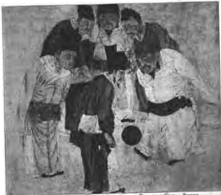
বিদ্যালয় খুলে দেওয়ার দিনে একটি বিশেষ অনুষ্ঠান। এই ছবি চীনের আবিষ্কার। উপরের তেলেটিতে সংগ্রহকারীর সম্রাট টাইহুং খুলে দেওয়া।

চায়নিজরা জানত এবং ব্যবহার করত। সাংহাই শহরে মাটি খুঁড়ে পাওয়া পট্টাবৃত্তে ১০, ২০, ৩০ এবং ৪০ সংখ্যার চিহ্ন পাওয়া গেছে, যা সেই সময়ের মানুষের ডেসিমেল সিস্টেমের জ্ঞানের কথায় বলে।