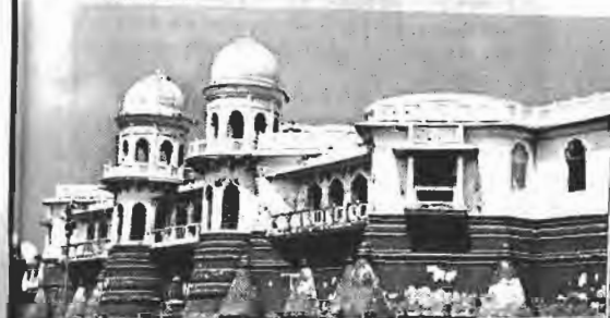
তপস্রাসান নীরমলক এতাল

একবার ত্রিপুরা যাবার সব ব্যবস্থা করার পরেও শেষ মুহূর্তে বাতিল করে দিলাম। কেন করলাম এখন মনে নেই, তবে হঠাৎ করে ত্রিপুরা যাবার সিদ্ধান্ত কেন নিলাম সেটা মনে আছে। এক সকালের কথা, নুহাশ পত্নীর বাগানে চায়ের কাপ হাতে নিয়ে ঘুরে বেড়াচ্ছি, হঠাৎ দৃষ্টি আটকে গেল। অবাধ হয়ে দেখি, নীলমণি গাছে খোকায় খোকায় ফুল ফুটেছে। অর্কিডের মতো ফুল। হালকা নীল