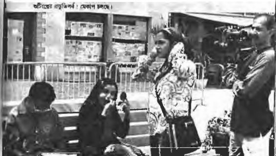
চরিত্রের প্রতীকিত্ব : মেলায় চলছে।