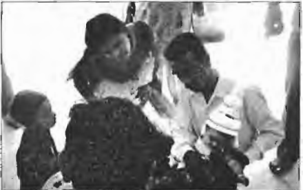
ত্রিপুরেশ্বরী মন্দিরে গণপিত্তো অনুষ্ঠান উদযাপন