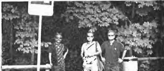
অভিনেত্রী স্বাধীন ও তারকার একজন— চিত্র পাঠক।

খ. অতি আধুনিক কেতায় সাজানো কিন্তু শপিংমল। পৃথিবীর হেন কোনো বস্তু নেই যা সেখানে নেই। নামেরও কোনো ঠিক-ঠিকানা নেই। দেশটা অতি