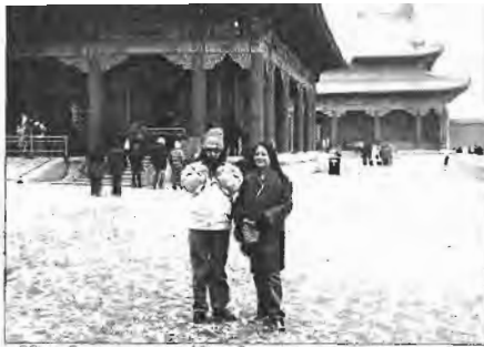
নিষিদ্ধ নগরীতে খুবাবপজকের মধ্যে দাঁড়িয়ে সার্বিক চালবেতার

নিষিদ্ধ নগরী হলো— Forbidden City. চায়নিজ ভাষায় গু গং (Gu Gong). বেইজিং-এর ঠিক মাঝখানে উঁচু পাঁচিলে ঘেরা মিং এবং জিং (Ging) সম্রাটদের প্রাসাদ। বিশাল এক নগর। প্রজারা কখনো কোনোদিনও এই নগরে প্রবেশ করতে পারবে না। এমনই কঠিন নিয়ম। এই নগর প্রজাদের জন্যে নিষিদ্ধ বলেই নগরীর নাম 'নিষিদ্ধ নগরী'।