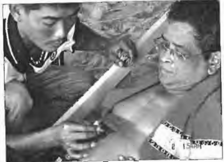
এঁকে হুসে ডাব।

আমার কাছে একটি গ্রন্থ আছে, নাম 'পৃথিবীর এক হাজার একটি অপর প্রাকৃতিক বিহয়, মৃত্যুর আগে যা দেখা জোমার অবশ্য কর্তব্য' (1001 Natural wonders you must see before you die) বইটি প্রায়ই আমি নেড়েচেড়ে দেখি। মৃত্যু তো ঘনিয়ে এলে— এক হাজার একের কয়টায় ক্রস মার্ক দিতে পারলাম তার হিসাব। বইটিতে বাংলাদেশের একটি মাত্র এম্ব্লি—