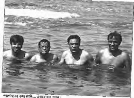
পঞ্চাশতকের কথা জানি—এখানে চার পাতাল।

আমি বনলাম, অভ্যাস নাই অভ্যাস করাবে। প্রথম প্রথম সিগারেট টানতে কুৎসিত লাগে। একবার অভ্যাস হয়ে গেলে মহানন্দ। বিয়ারের ক্ষেত্রেও একই ব্যাপার—প্রথম চুমুকে তিতা বিষের মতো এক বস্তু, তারপর ক্যামা মজা! যাই হোক, ব্যাংককে যাব মনস্থ করেছি। ব্যবস্থা করো।