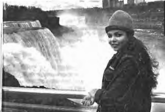
শাবন নামেরা জলপ্রপাত ঘুর হয়ে দেখছে, এই হলো হবির বিখ্যাতক। তার উচিত জলপ্রপাতের দিকে তাকিয়ে থাকে, সে তাকিয়ে আছে ক্যামেরার দিকে। নারীরা হবার এই এক সমস্যা।

এক ফাঁকে বলে নেই— ধর্মত্রাণ (১) এবং ধনবান আরবদের একটি বড় অংশ আমেরিকায় আসেন জুয়া খেলতে। রুনেটের টেবিলে গম্বীর ভক্তিতে বসে থাকেন। তাঁদের হাতে থাকে তসবি। সামনের গ্রাসে অতি দামি হুইস্কি। জুয়া