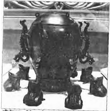
প্রাচীন সিন্দোয়াঞ্চ। এটি চীনাঙ্গের আবিষ্কার।

অঙ্কে ডেসিমেল সিস্টেম এখন সারা পৃথিবীতেই ব্যবহার করা হয়। কম্পিউটারে ব্যবহার করা হয় বাইনারি সিস্টেম। ডেসিমেল সিস্টেম এখন ভাল-ভাত, অথচ মানবজাতিকে দর্শনাত্মিক এই অঙ্কে আসতে শত বছর অপেক্ষা করতে হয়েছে। নিওলিথিক সময়ে (৬০০০ বছর আগে) এই ডেসিমেল সিস্টেম