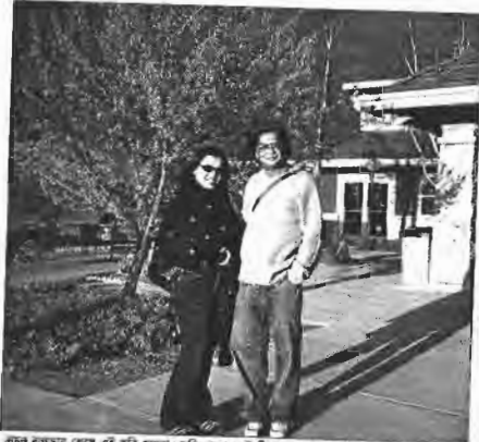
এক কণ্ঠার শেষে এই ছবি তোলা। ছবি দেখে কেই কি আ বুকেব ? ছবি দিয়া কথা বলে।