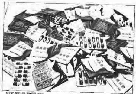
চারশ' ডলারের অসুখ ওষুধ।

চেসিঞ্জ খাঁ'র সঙ্গে চীন দেশীয় চারজন ডেভজ বিজ্ঞানীর সাক্ষাৎকার বিষয়ক একটি গল্প বন্দি।