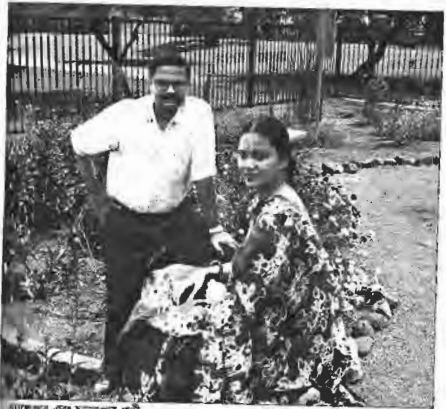
চ্যালেঞ্জার এবং চ্যালেঞ্জার-পত্নী

কমলও আমার নাটকের অভিনেতা। ডায়ালগ ছাড়া অভিনয়ে সে অতি পারঙ্গম। ডায়ালগ দিলেই নানা সমস্যা। তোতলামি, মুখের চামড়া শক্ত হয়ে যাওয়া, হাত-পা বেঁকে যাওয়া শুরু হয়। সে আমার নাটকে অতি দক্ষতার সঙ্গে, রাইফেল কাঁধে মুক্তিযোদ্ধা, পাকিস্তান আর্মির সেপাই, পথচারী, দুর্ভিক্ষে