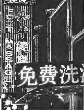
এক হুপ আগেও বেইজিং-এ ম্যাসাজ পার্লর চোখে পড়ে নি। আধুনিক চীনের অনেক রূপান্তরে এটি একটি।

হয়ে দেখি, আমাদের মহান ডাক্তার ক্রিশ ইয়েনে শাওনের মূর্তি বানাতো রাভি: হয়েছেন।