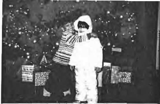
হোটেল দারিতে ভুলে গুই সফরঙ্গী অরিজানা-অমি, পেছনে কিসদাস টি।

তাপমাত্রা শূন্যের আঠারো-উনিশ ডিগ্রি নিচে চলে যাবার কথা। এই হিসাব কেমন করে করা হয় আপে জানতাম। এখন ভুলে গেছি।