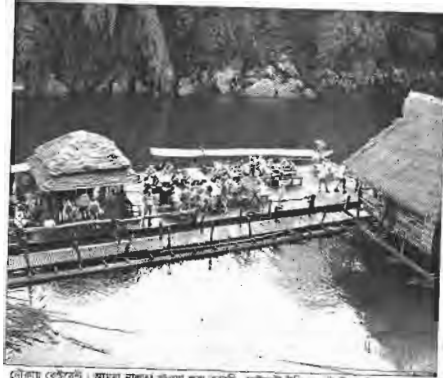
নৌকায় বেঁকুনেটি। আমরা মালভা খাতায় তুলে করছি, বেঁকুনেটি ইন্ডিন সোটা নিয়ে টেনে নিয়ে যাওয়া হচ্ছে। দু'পাশের অশুভ দৃশ্য দেখে এতখি।

হয়ে। তার সঙ্গে অতি রূপবতী এক থাই কন্যা। মায়াময় চোখ। উজ্জ্বল গায়বর্ণ। মাথাভর্তি মন কালো চুল।