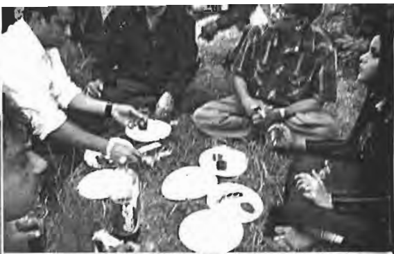
নাটিকে পিকনিকের একটি দৃশ্য আছে। পিকনিকের দৃশ্য করার জন্য রাইন নদীর পাশে ছোট্ট পার্কের মতো একটি জায়গা খুঁজে বের করা হলো।

একটা শুকনো পাতা বা মরা ডাল নেই। গাছের নিচেও শুকনো পাতা পড়ে থাকা দরকার। সেইসব কোথায় গেল? পাতা কুড়ানির দল তো চোখে পড়ল না।