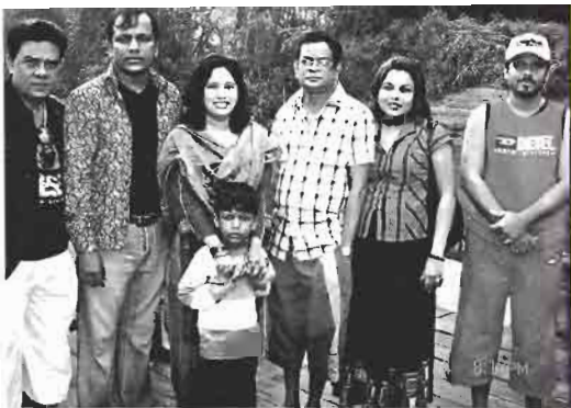
শ্যামদেশের সড়কদপ্তার। অব্যাক তো দেখছি না। সে কার কাছে ?

সবাই খেলনা দেখে মজা পাচ্ছি। থাই মেয়েটি জানতে চাইল, খেলনার দাম কত ? মাছহার বলল, পাঁচশ' বাথ।