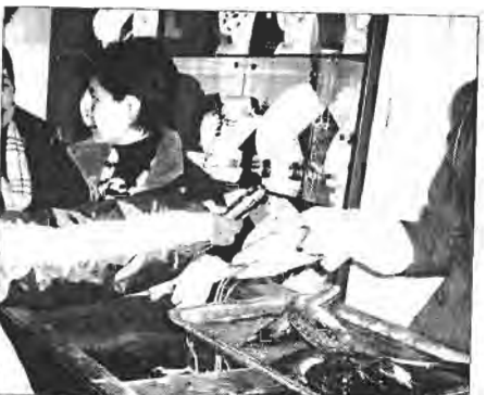
ঝিনুক খোলা হলো। ঝিনুক ভর্তি মুক্তা। মুক্তা গোনা হলো এবং দেখা গেল মুক্তার সংখ্যা ১৭।

ঝিনুক খোলা হলো। ঝিনুক ভর্তি মুক্তা। মুক্তা গোনা হলো এবং দেখা গেল মুক্তার সংখ্যা ১৭। কাকতালীয় এই ঘটনার ব্যাখ্যা আমি জানি না। আমি আমার এক জীবনে অনেক কাকতালীয় ঘটনার সন্মুখীন হয়েছি। এটি তার একটি। চ্যালেঞ্জারকে একটা বড়সড় মুক্তা দেয়া হলো। সঙ্গে সঙ্গে চ্যালেঞ্জারের চোখ পানি। তার চোখের অশ্রু গ্যাত্তে মনে হয় কোনো সমস্যা আছে, সে কারণে এবং সম্পূর্ণ অকারণে চোখ থেকে এক দেড় লিটার পানি ফেলতে পারে।