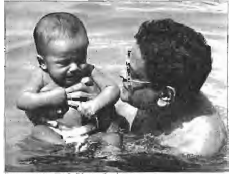
পাতালার সমুদ্রে সফরের সর্ব কনিষ্ঠ এবং সর্ব স্মৃতি সদস্য

মনে হচ্ছে বড় এক দিঘি। সমুদ্র সৈকত নামের জায়গাটা বস্তির মতো যিঙ্গি। সমুদ্র থেকে একহাত জায়গা ছেড়ে চেয়ারের গায়ে চেয়ার লাগানো। চেয়ারের মাথায় ছাতা এত ঘন যে নিচটা অন্ধকার হয়ে আছে। শত শত ফেরিওয়ালো ঘুরছে। কাটা ফল, ভাজা রুটকি, ডাব। গা মালিশওয়ালারা তেলের শিশি নিয়ে ঘুরছে। উকি আঁকাওয়ালারা ঘুরছে উকির জিনিসপত্র নিয়ে। হাটবারের মতো মানুষ। এদের মধ্যে অসভ্য বুড়ো আমেরিকানরা কিশোরী