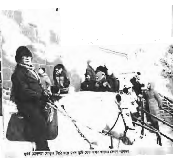
দুর্ঘটনায় মোগলরা ফেড়ার পিঠে চড়ে এখন ছুটে বের হবার তাদের কোন দায়তা

আমি আরো মুগ্ধ। এই জ্ঞানবৃদ্ধি নাড়ি ধরে জেনে ফেলেছেন যে, আমার বাইপাস হয়েছে। কী আশ্চর্য!