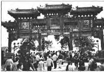
গীচ গ্রামের মেখে সবাই মুগ্ধ। সড়টিয়া হারুকোর তেলো নিয়েছেন নিজের গীচ গ্রামের বনাতো। সড়টিয়া গরমে কষ্ট করবেন তা নী করে হা।

আমার মন ভালো নেই, কারণ আমার চিকিৎসা হয়েছে।