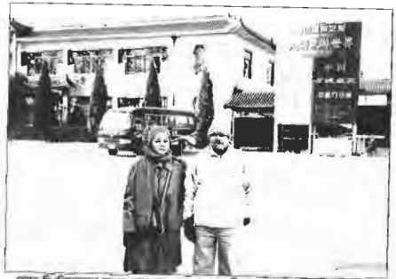
ভেষজ বিশ্ববিদ্যালয়ের সামনে চায়নিজ ও চ্যান্সেলর পর্দা।

আমাদের একটা ঘরে চুকিয়ে দেয়া হলো। স্মার্ট তরুণী ব্যাখ্যা করলেন আধুনিক চিকিৎসাশাস্ত্র, বিশেষ করে অ্যান্টিবায়োটিক, কী করে আমাদের জীবনীশক্তি সম্পূর্ণ ধ্বংস করে দিচ্ছে। ভেষজ বিজ্ঞানই আমাদের একমাত্র পরিব্রাতা। তিনি জানালেন, তিনজন চিকিৎসক একসঙ্গে ঘরে ঢুকবেন। তাঁরা কেউ চৈনিক ভাষা ছাড়া কিছুই জানেন না। সবার সঙ্গে একজন করে ইন্টারপ্রেটার থাকবে।