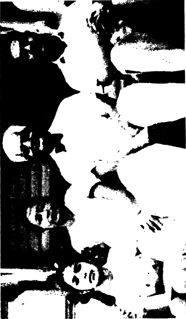
ফ্যামিলি গ্রুপ ১৯৫২