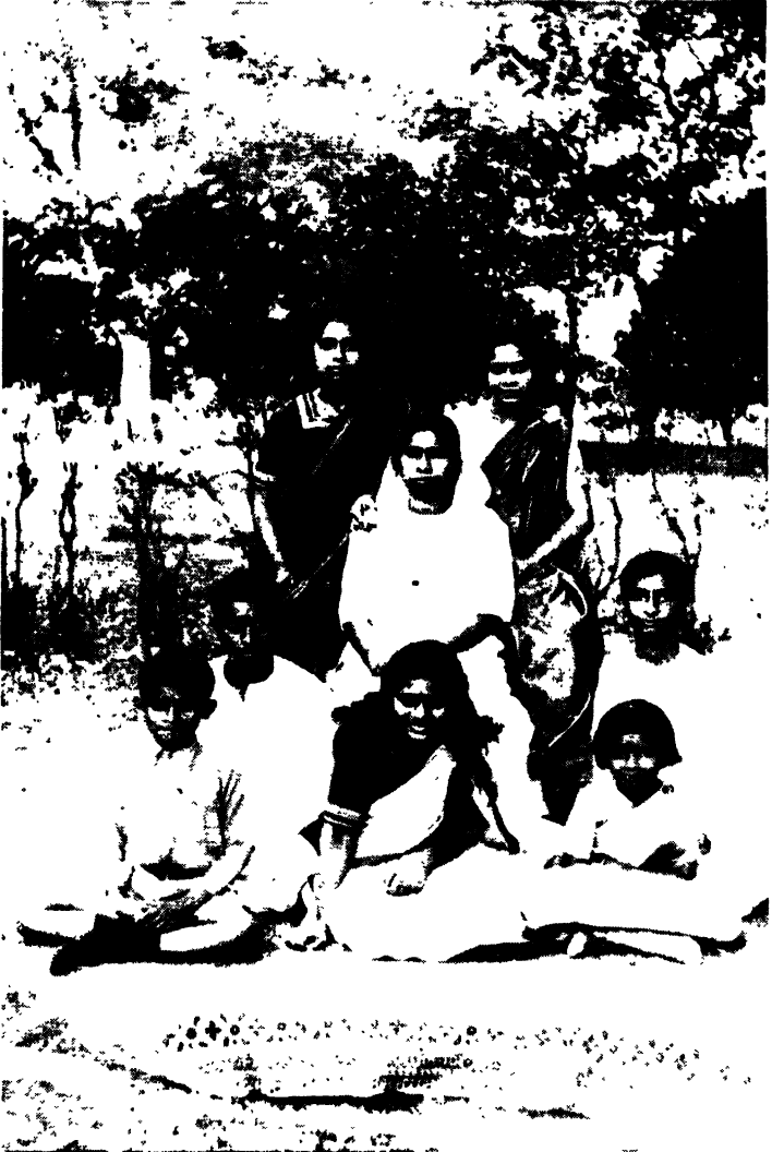
হাজারি বাগের গ্রুপ ফটো ১৯২৫