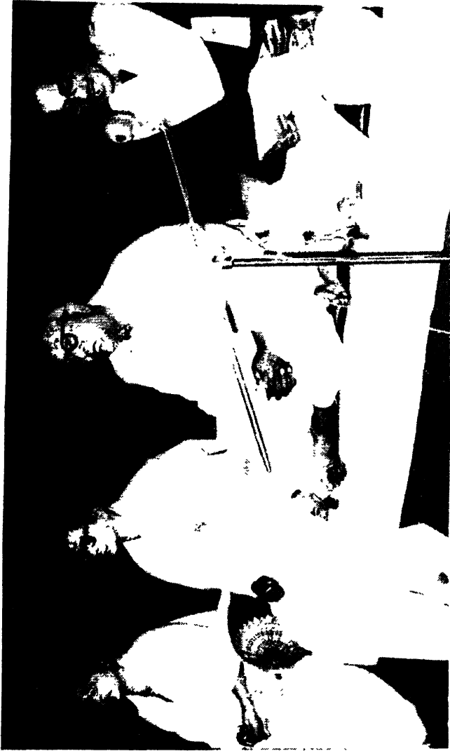
রবীন্দ্রমেলা, শান্তিনিকেতন ১৯৫৯