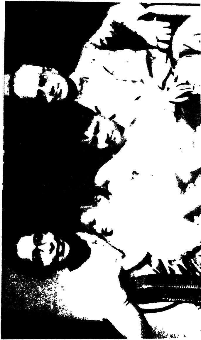
ফ্যাশিন্সি গ্রুপ ১৯৩৮