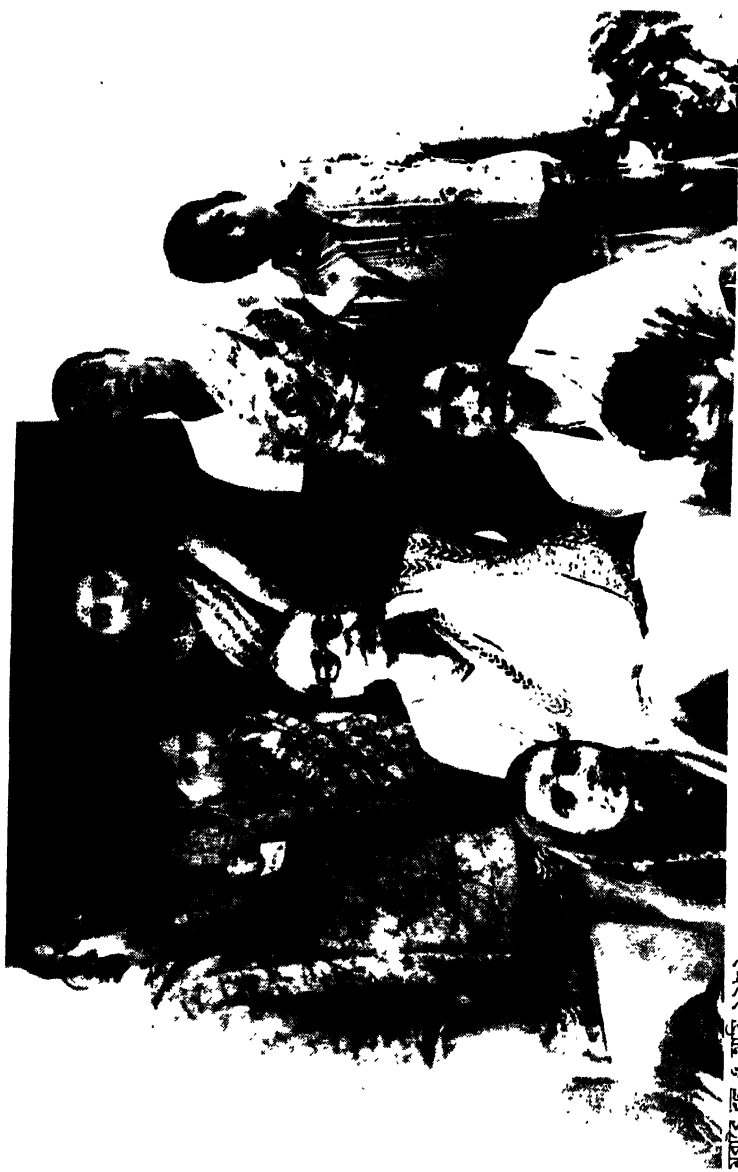
ケルンハルツの歴史