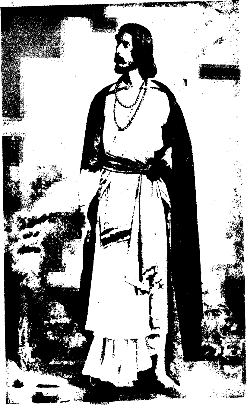
বাল্মীকিপ্রতিভা অভিনয়ে বাল্মীকির ছাঁমকায় রবীন্দ্রনাথ