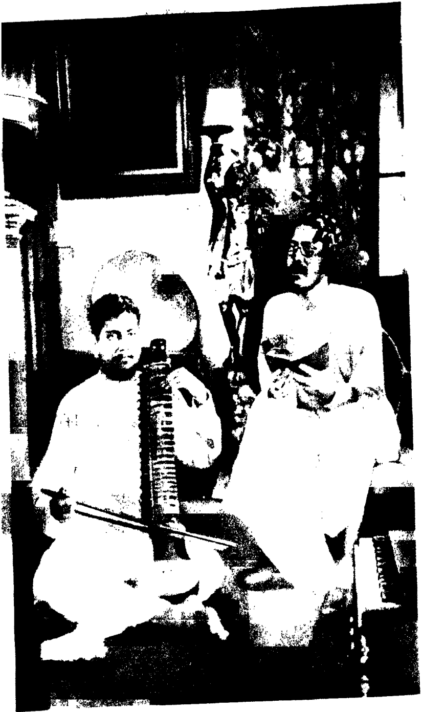
श्रीगुरुनाथ ७ श्रीगुरुनाथ